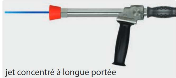
jet concentré à longue portée