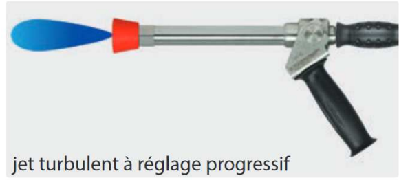
jet turbulent à réglage progressif